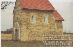
Kostel sv. Margity v nitranských Kopcích je jedinou dosud stojící velkomoravskou stavbou. Byl patrně součástí satelitního dvorce mnišského hradu (leží od něj z km přes řeku Moravu).

Nitranské hradiště na ostrohu nad řekou Nitrou, která opevněné sídlo chránila ze tří stran, Mojmir viděl už z dálky, neboť šlo o dominantní krajinný bod. Byl Pribina moravským vojskem zaskočen? Došlo